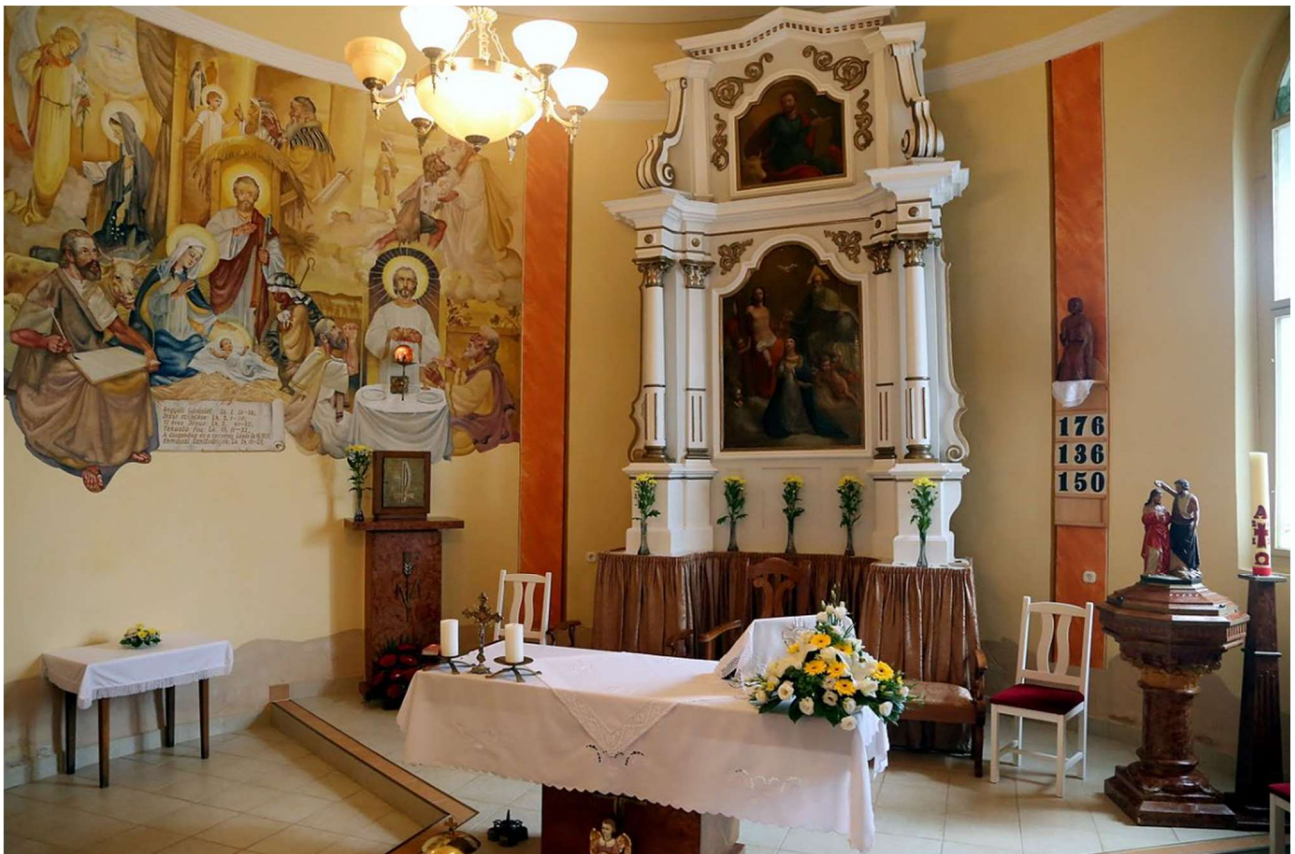
Kondorfa templom főoltára – Szentháromság és Szent Lukács evangélista